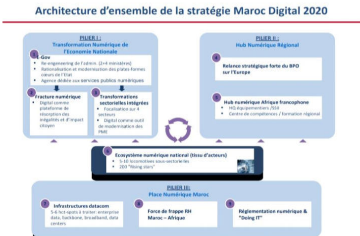
Figure 1 : Architecture d'ensemble de la stratégie Maroc Digital 2020

Stratégie Maroc Digital 2020 : Selon le gouvernement marocain, cette stratégie s'articule autour de trois piliers et neuf initiatives :